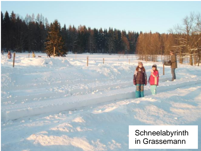
Schneelabyrinth in Grassemann

Das Labyrinth ist ein uraltes Symbol, das sich aus der schon in der Steinzeit verwendeten Doppelspirale entwickelt hat. In allen Kulturen gibt es Labyrinth in unterschiedlichen Formen.